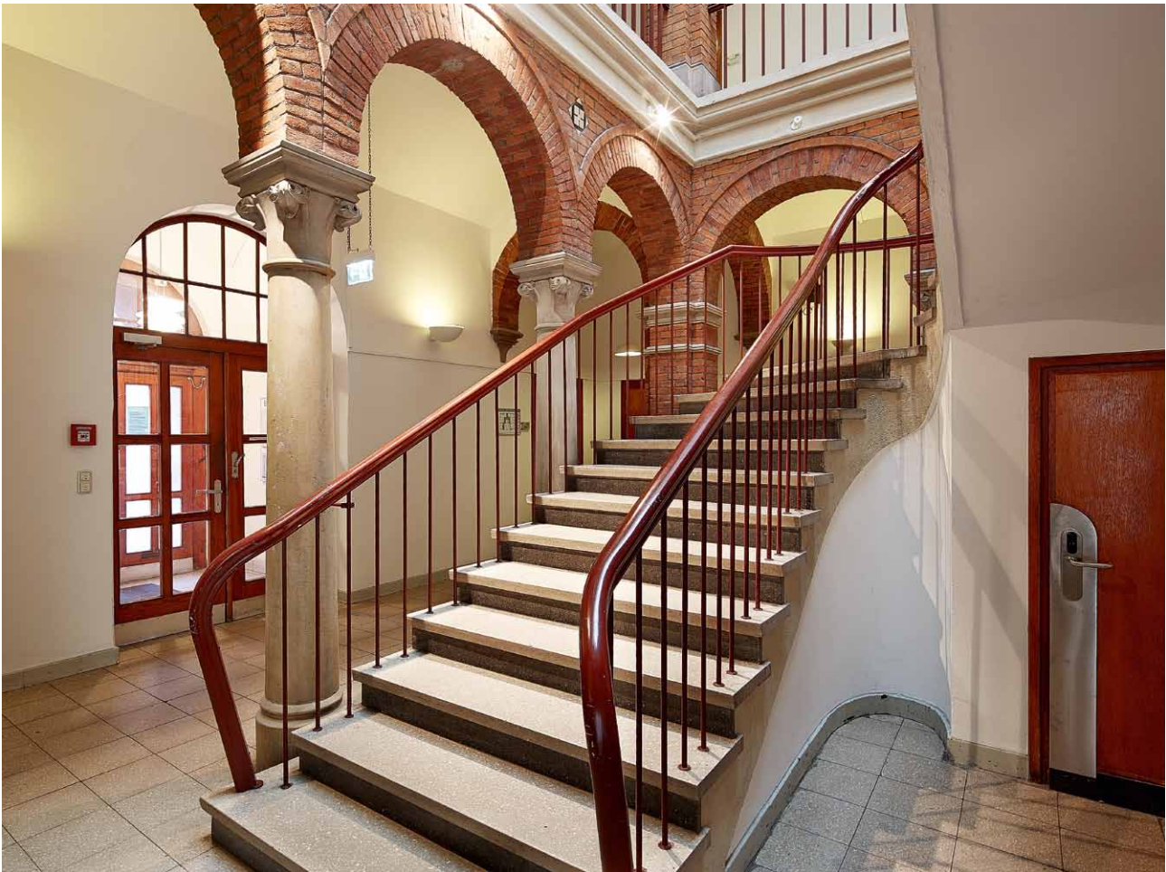
XS4 Original Beschläge im denkmalgeschützten Ausbildungsgebäude des EKM