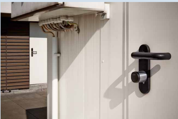
Bild unten: XS4 GEO Zylinder sichert den Zugang zu einer auf dem Dach befindlichen technischen Betriebsanlage.

Bild oben: 2 XS4 GEO Zylinder für beidseitige Prüfung der Zutrittsberechtigungen an einer Verbindungstür zwischen öffentlichem und nicht öffentlichem medizinischem Bereich.