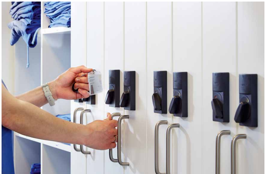
XS4 Spindschlösser sichern die Spinde des Personals