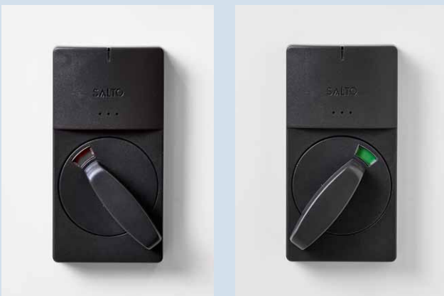
Bild oben: Freigabe eines XS4 Lockers an einem Patientenschrank. Bilder unten: Optische Anzeige des gesicherten (rot) und offenen (grün) Zustands. Nach Freigabe durch einen berechtigten Zutrittsausweis lässt sich der Hebel drehen.

> Im EKM zur Sicherung von Patientenschränken, Mitarbeiter-spinden, mobilen Pflegewagen, Medikamentenschränken sowie diversen Schränken in den OP- und Kreißsälen.