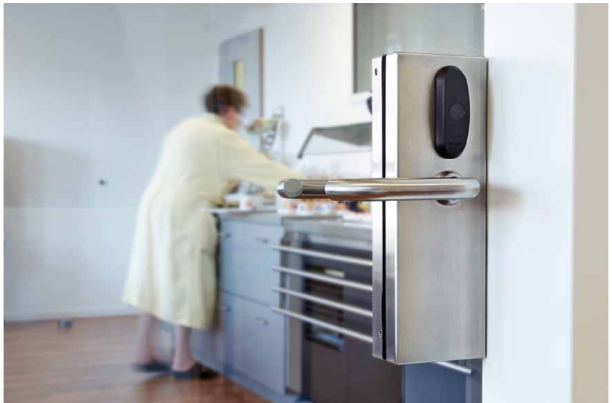
XS4 Original Glastürbeschlag an der Tür zu einem Speiseraum für Patienten