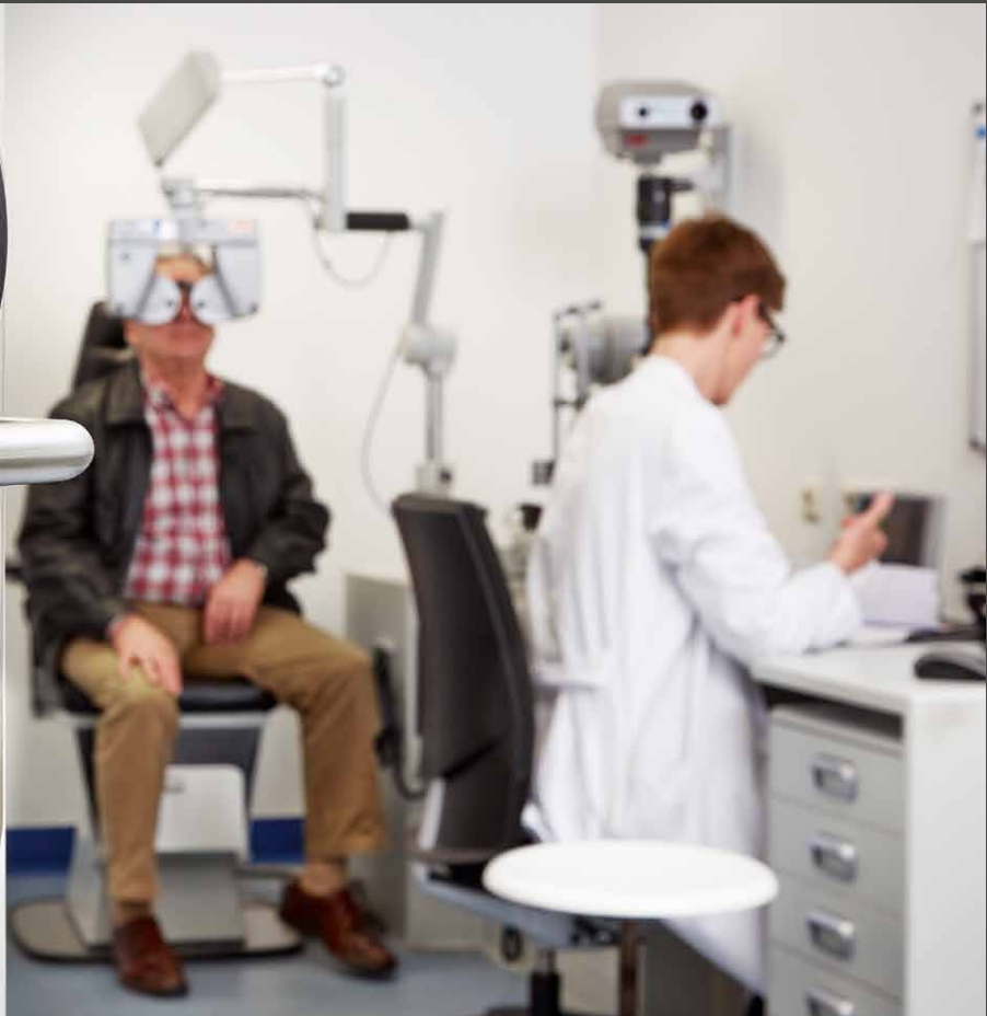
XS4 Original Beschlag sichert die Tür eines Behandlungszimmers in der Augenklinik