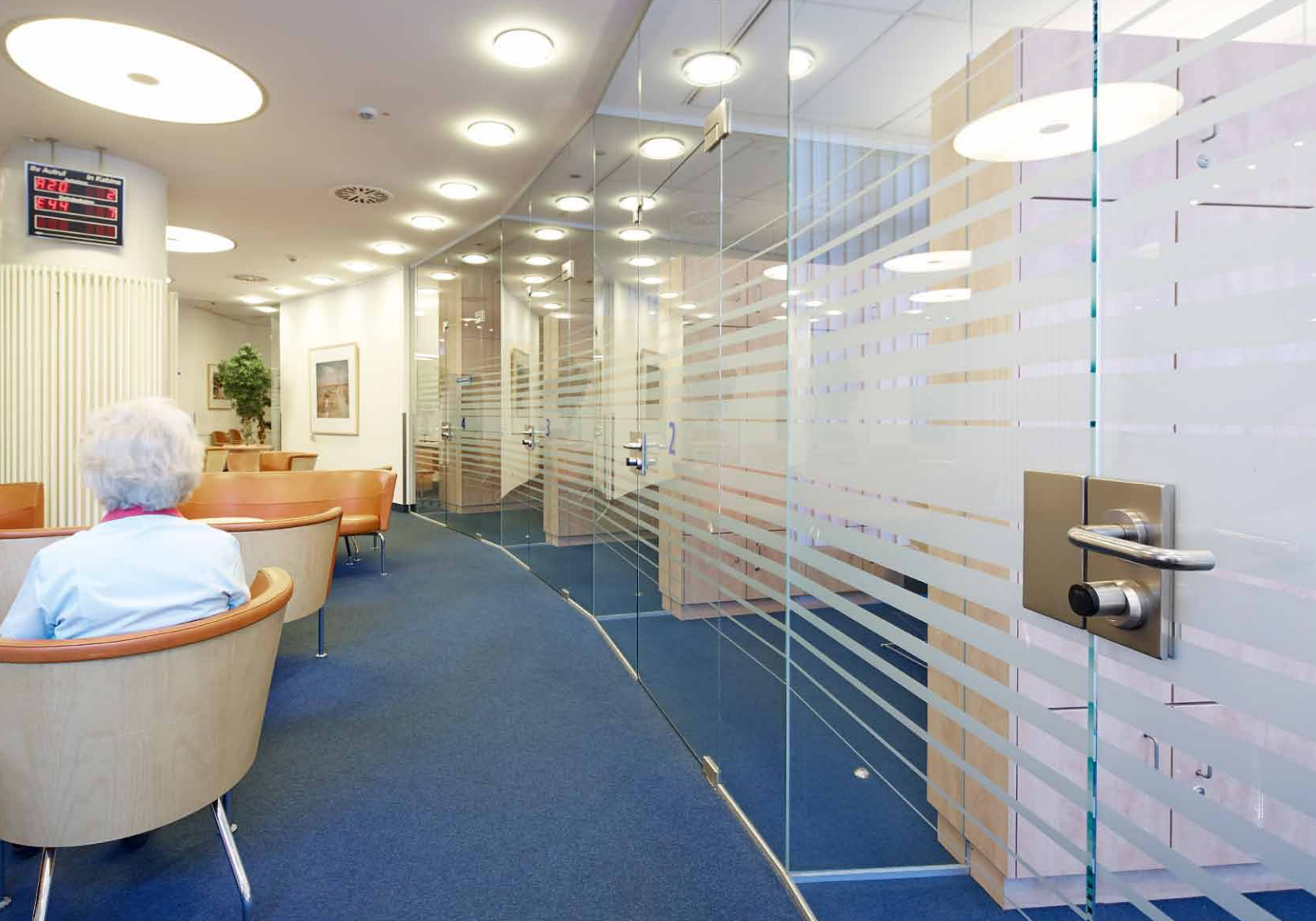
Außerhalb der Öffnungszeiten sind die Türen der Patientenaufnahme über XS4 GEO Zylinder zutritts-gesichert