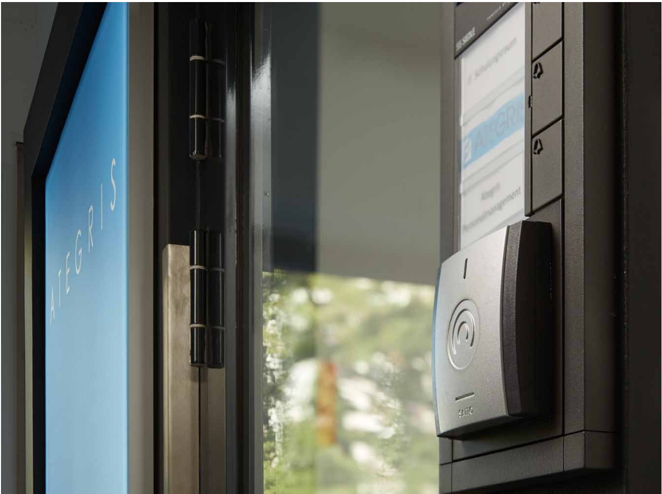
XS4 Original Wandleser mit Update-Funktion am Außeneingang der ATEGRIS Verwaltung