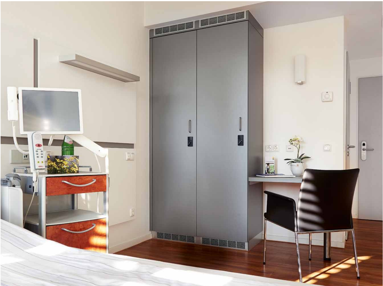
XS4 Locker (elektronische Spindschlösser) sichern die Patientenschränke

„SALTO hat eine so große Produktvielfalt, dass man fast nie zu einer Lösungsanfrage Nein sagen muss.“