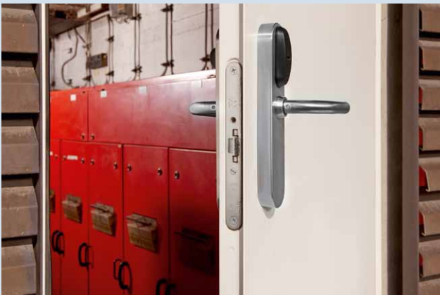
Bild unten: XS4 Türbeschlag sichert die Außentür eines Technikraums.

Produktvariante mit „Bitte nicht stören“-Funktion, siehe Seite 7: Durch das Drücken des Knopfs auf der Innenseite des Beschlags ist der Zutritt zur Toilette von außen auch für sonst zugriffsberechtigte Medien gesperrt. Lediglich Masterkey-Medien können (etwa in Notfällen) die „Bitte nicht stören“-Funktion übersteuern.