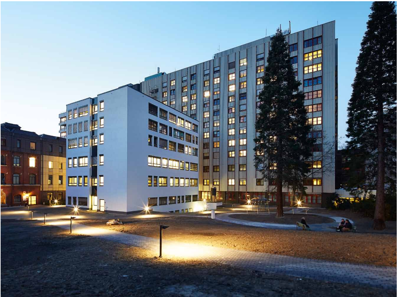
Evangelisches Krankenhaus Mülheim mit renoviertem Altbau und vorgelagertem Neubau