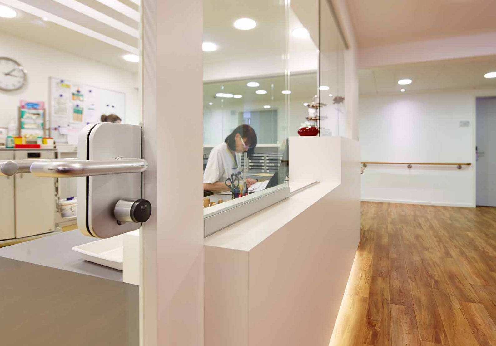
XS4 GEO Zylinder schützt das Schwesternzimmer vor unberechtigtem Betreten bei Abwesenheit des Pflegepersonals