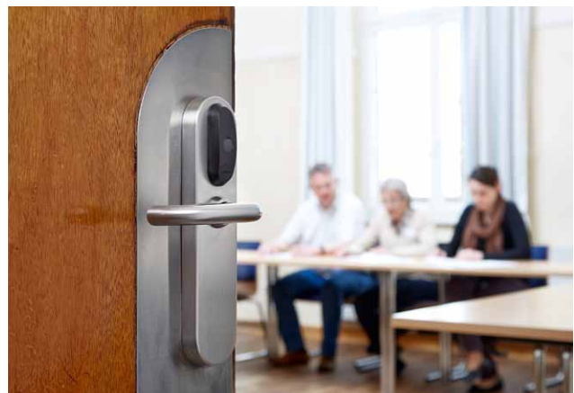
XS4 Original Beschlag

Die sogenannte „Backsteinschule“ liegt ebenfalls nur wenige Schritte vom EKM entfernt. Das 1862 im spätklassizistischen Stil errichtete Gebäude diente ursprünglich als Waisenhaus und wurde von ca. 1874 bis 1970 als Schule genutzt. Heute bietet das denkmalgeschützte Haus Raum für die Ausbildung von Gesundheits- und Krankenpfleger/innen sowie Operationstechnischer Assistentinnen und Assistenten. Zudem finden hier ganzjährig diverse Fort- und Weiterbildungsmaßnahmen statt. Elektronische XS4 Beschläge sichern die Lehrräume vor unberechtigtem Zutritt.