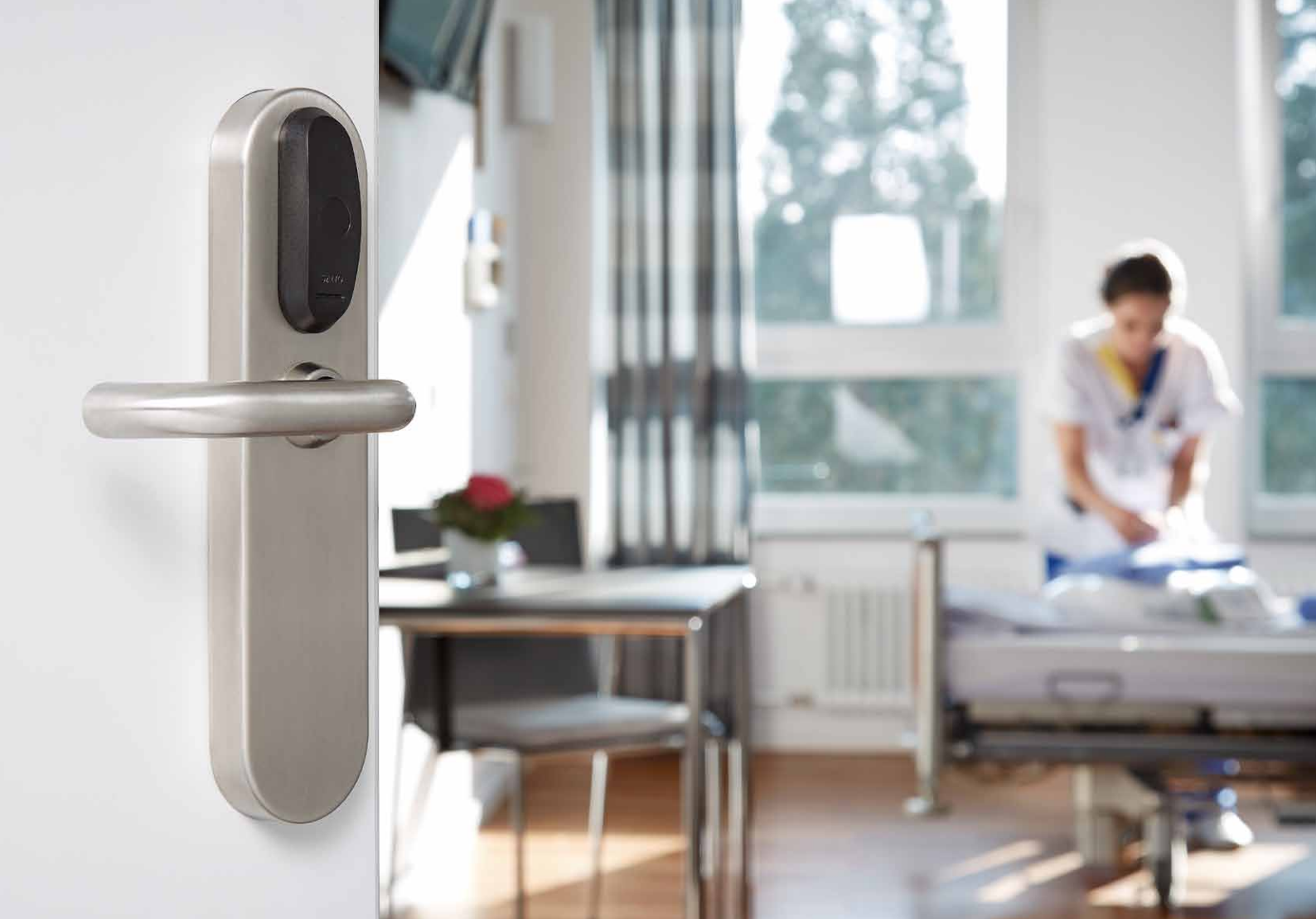
XS4 Original Türbeschläge sichern die Patientenzimmer