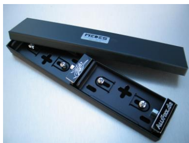
Abb. AluFixx Car-Vario

liefern wir in schwarzer Geschenkverpackung.