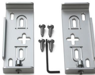
Abb. AluFixx Car-Vario