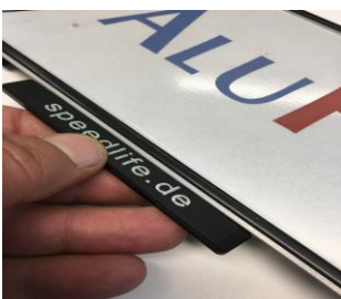
Abb. Alu-Motivträger zur individualiesierung