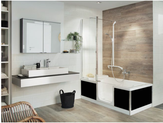
(Foto Kinedo-Duo-Badezimmer) Duschbadewanne DUO – Eckinstallation, Außenverkleidung aus schwarzem Glas 165 (Foto: SFA Deutschland)