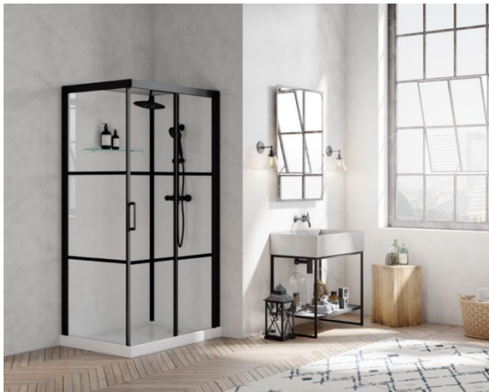
(Foto Brooklyn Factory 110 x 80) Voll ausgestattete Komplettduschkabine mit 170 Industriecharakter.