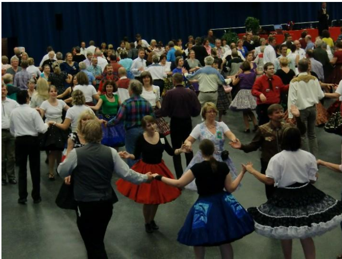
Fall Round Up 2010

Gemeinsam besuchen wir andere Square-Dance-Clubs, nehmen an Events anderer Vereine teil bzw. organisieren sie mit ihnen zusammen.