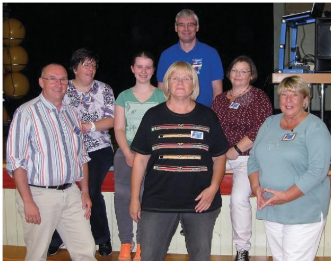
Eine Class bei den Assindian Star Dancers

Wenn Du Spaß und Lust an Square-Dance gefunden hast, kannst Du gerne unsere nächste „Class“ besuchen und diesen wunderbaren Tanzsport erlernen.