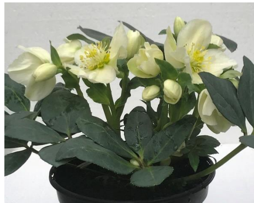
Hellebore 'Diego Ice'