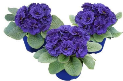
Primula acaulis 'Rubens'