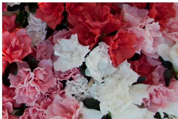
Hortinno Multicolor 'Christine Quads'

Nog nieuw in het assortiment van azaleakwekerij Floramor is de Hortinno Multicolor collectie, een mix van diverse soorten samengebracht in één en dezelfde azalea. De Hortinno Multicolor collectie zijn kamerazalea's.