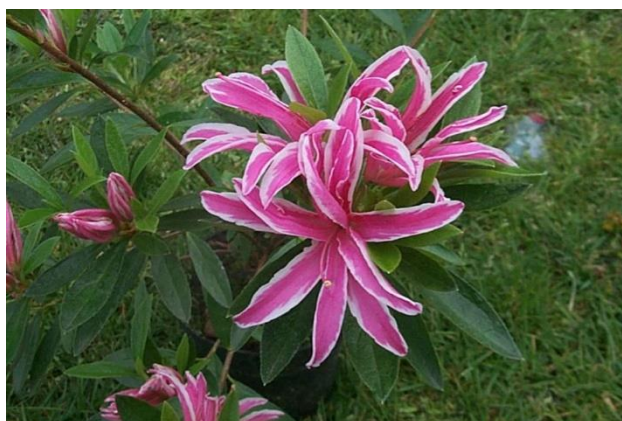
Azalea japonica 'Pink Spyder'

Leybaert bvba is een productiebedrijf met sterke specialisatie in Azalea indica, Rhododendron, Vaccinium corymbosum en Chamaecyparis ellwoodii. Dit bedrijf van 19 ha staat dankzij grootschaligheid en automatisering garant voor kwaliteit, uniformiteit en continuïteit. Ontdek hun laatste nieuwigheid, de Azalea japonica 'Pink Spyder' tijdens IPM Essen.